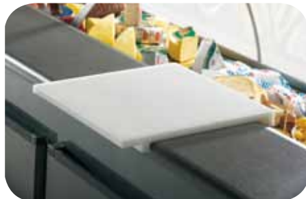
Asse tagliere. Cutting board. Planche à couper. Schneidebrett. Tabla de corte. Доска для резки.