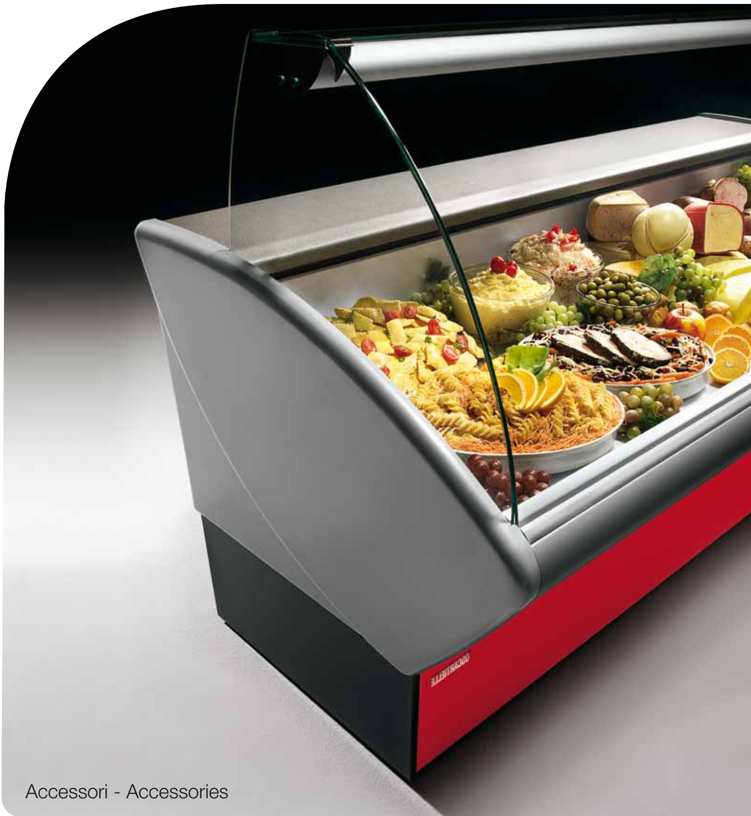
Accessori - Accessories