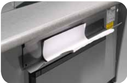
Portacarta. Paper holder. Porte papier. Papiertaschen. Portapapeles. Салфетница.