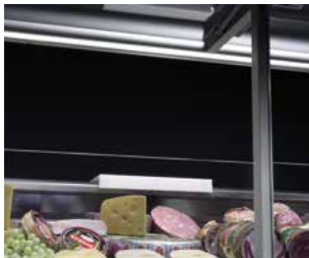
illuminazione LED. Lighting LED. Éclairage LED. LED-Beleuchtung. Iluminación LED. Светодиодное освещение.