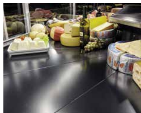
Piano esposizione nero. Black display level. Plan d'exposition noir. Schwarze Ausstellungsfläche. Superficie de exposición de color negro. Черная поверхность витрины.