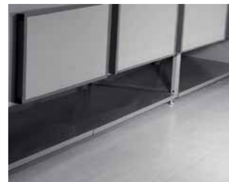
Vano posteriore a giorno. Open rear compartment. Réserve arrière ouverte. Offenes Vorratsfach im Möbelunterbau. Local posterior abierto. Заднее отделение открытое.