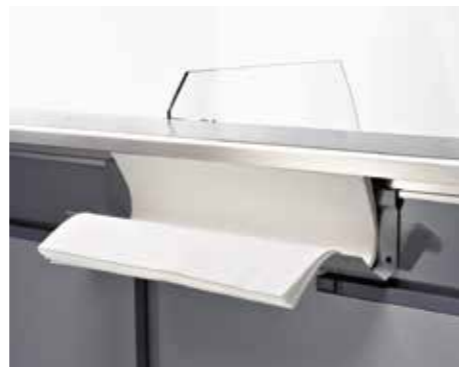
Portacarte. Paper holder. Porte papier. Papier Träger. Portapapel. Салфетница.