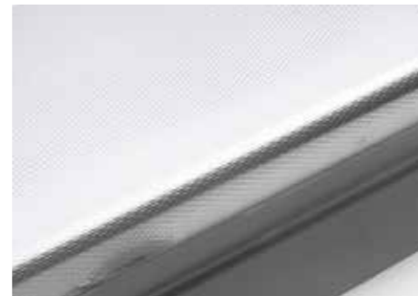
Piano lavoro inox. Stainless steel counter. Tablette de travail inox. Arbeitsplatte aus Edelstahl. Рабочая поверхность из нержавеющей стали inox.