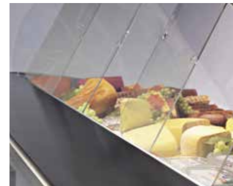
Scorrevoli posteriori. Sliding rear doors. Coulissantes postérieures. Schiebescheiben. Corredizos posteriores. Задние раздвижные дверцы.