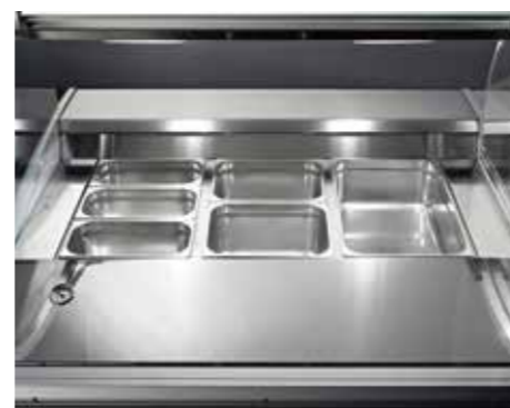
Vaschette gastro-norm. Gastro-norm trays. Bacs Gastronorm. Gastronorm Schalen. Cubetas Gastronorm. Лотки гастро-норм.