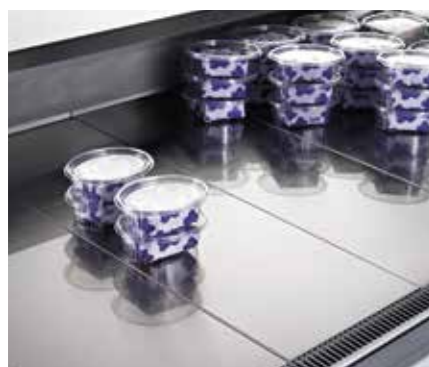
Piano esposizione inox. Stainless steel display surface. Surface d'exposition en acier inox. Auslagefläche aus Edelstahl. Estante de exposición en acero inox. Экспозиционная поверхность из нержавеющей стали.