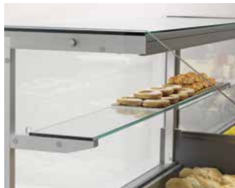
Piano intermedio. Intermediate shelf. Étagère intermédiaire. Zwischenetage. Estante intermedio. Промежуточная полка.