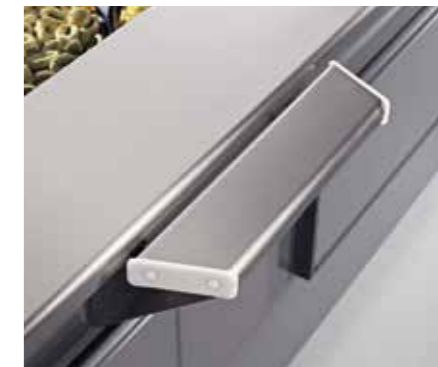
Estensione piano lavoro 350 mm. Working shelf extension 350 mm. Extension pour tablette travail 350 mm. Erweiterung für Arbeitsplatte 350 mm. Extension estante de trabajo 350 mm. Удлинитель рабочего стола 350 mm.