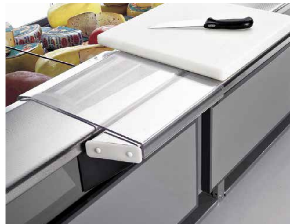
Estensione piano lavoro 700 mm - Asse tagliere - Piano per incarto in plexiglas. Working shelf extension 700 mm - Cutting board - Wrapping table in plexiglas. Extension tablette de travail 700 mm - Planche à couper - Tablette pour emballage en plexiglas. Verlängerung der Arbeitsplatte 700 mm - Schneidebrett Verpackungsfläche aus Plexiglas. Extensión estante de trabajo 700 mm - Tabla de corte - Superficie para envolver en plexiglás. Удлинитель рабочего стола 700 мм - Доска для резки - Стол из плексигласа для упаковки.