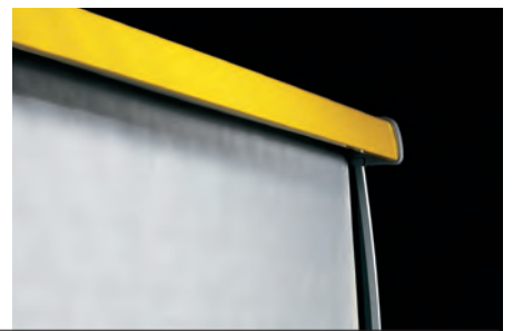
Tenda notte. Night blinds. Rideau de nuit. Nachttrollo. Cortina nocturna. Ночная шторка.