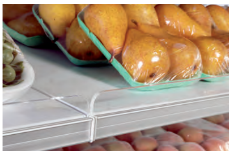
Spondine in plexiglas H45. Plexiglas front riser H45. Balconnet Plexiglas H45. Frontgitter aus Plexiglas H45. Barandilla plexiglass H45. Бортики из оргстекла H45.