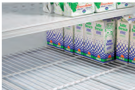
Griglie di fondo. Base grids. Grille de fond. Bodengitter. Rejilla cuba. Донные решетки.