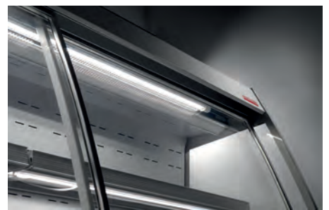
Illuminazione ripiani. Shelf lighting. Éclairage étagère. Beleuchtung für Etagen. Iluminación estantes. Подсветка полок.