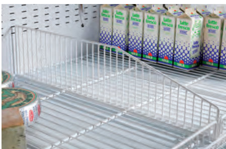
Divisori in filo per vasca. Base wire divider. Séparation cuve en fil. Trenngitter für Bodenauslage. Divisor cuba. Решетчатые перегородки для ванны.