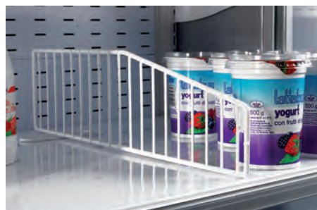
Divisori in filo per ripiani. Wire shelf divider. Séparation étagère en fil. Trenngitter für Etagen. Divisor estante. Решетчатые перегородки для полок.