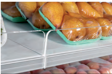
Spondine in plexiglas H80. Plexiglas front riser H80. Balconnet Plexiglas H80. Frontgitter aus Plexiglas H80. Barandilla plexiglass H80. Бортики из оргстекла H80.