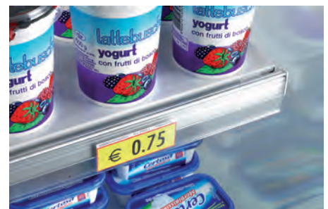
Portaprezzi trasparenti per ripiani. Transparent shelf ticket channel. Porte prix transparente étagère. Transparente Preisschienen für Etagé. Portaprecios transparentes estantes. Прозрачные ценники для полок.