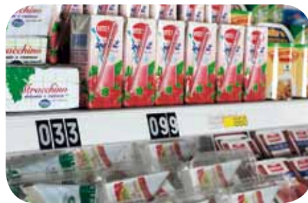
Portaprezzi trasparenti. Transparent ticket channel. Porte prix transparente. Transparente Preisschienen. Portaprecios transparentes. Прозрачные ценники.