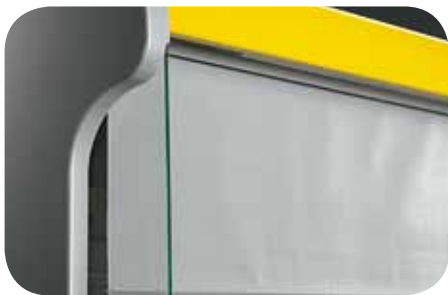
Tenda notte. Night blinds. Rideau de nuit. Nachttrollo. Cortina nocturna. Ночная шторка.